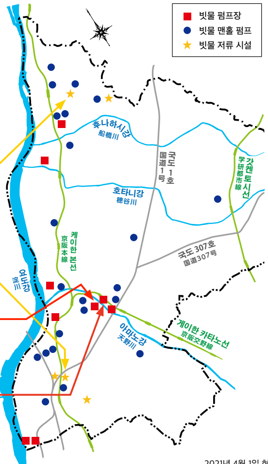
히라카타시의 주요 빗물 배수 시설

*빗물 저류 시설이란 빗물을 일시적으로 모아 두고 비가 그친 후 배수하는 시설입니다.