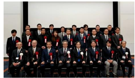
1月20日に開催された授賞式の様子。

★おおさか環境にやさしい建築賞は、地球温暖化やヒートアイランド現象防止等、環境への配慮に優れた建築物を顕彰する制度で大阪府気候変動対策の推進に関する条例及び大阪市建築物の環境配慮に関する条例に基づき実施するもの。「大阪府知事賞」「大阪市長賞」「住宅部門賞」「事務所部門賞」「商業施設その他部門賞」の各部門から計10施設が表彰された。