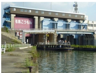
毛馬閘門を通過する様子