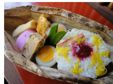
▲枚方割烹「藤」特製 下りの旅弁当 (イメージ)

※上り便・下り便ともに、「枚方くらわんか酒」(1杯400円)などを数量限定で販売!