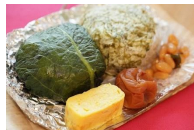
▲大阪「丸万寿司」特製 上りの旅弁当 (イメージ)