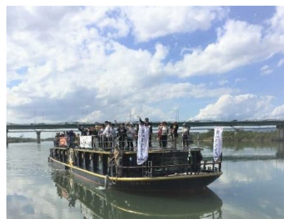
メインで使用するクルーズ船「ひまわり」