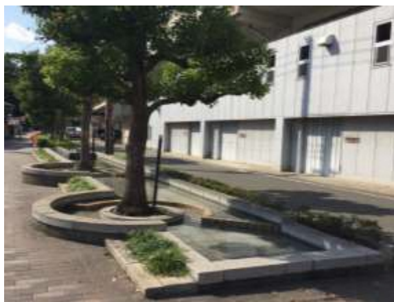
都市計画道路京阪南 2 号線の高架側道の歩道に設けられたせせらぎ水路