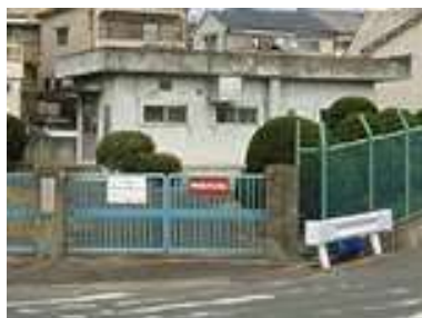
長尾家具町汚水中継ポンプ場(長尾家具町4丁目)