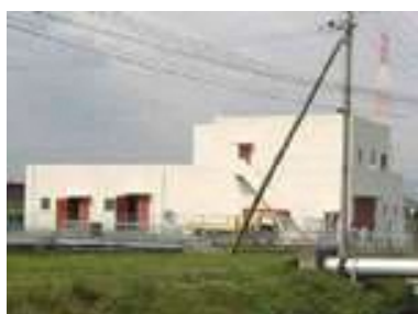
出口汚水中継ポンプ場(出口6丁目)