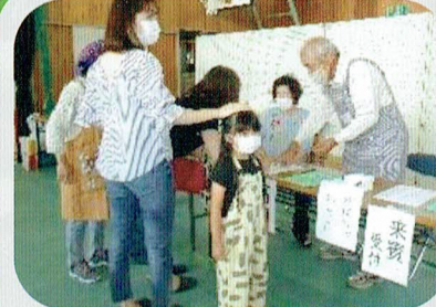
ただいま受付中 体育館が大変身?!