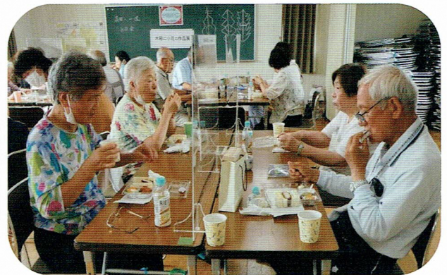
久しぶりに、一緒にいただく昼食は私語を控えながらも、和やかな雰囲気でした