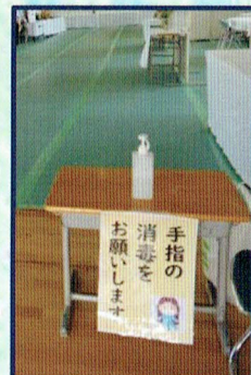
手指の 消毒を お願いします