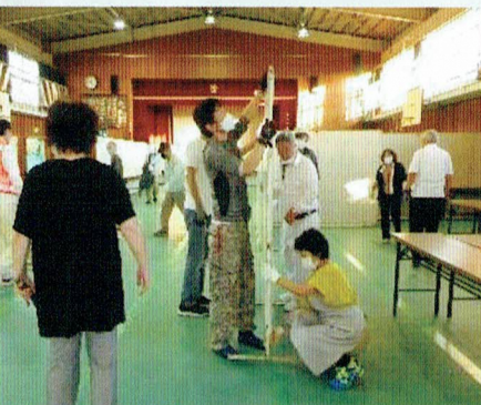
設営や撤収で、頼もしい活躍ぶり (東香里コミュニティ協議会、ボランティアの方々と力を合わせて)