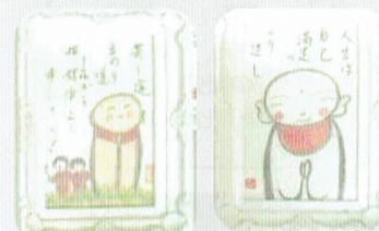
なごみ地蔵さま 初めて見にきたけれど、 出展してみたいなあ