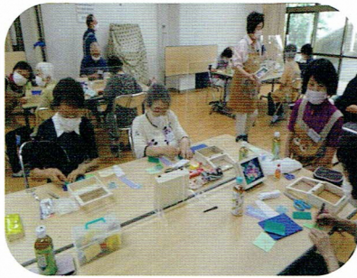
あじさいの葉はギザギザ？