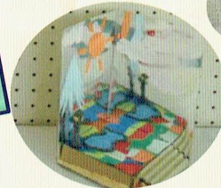
神社前のふしぎな広場