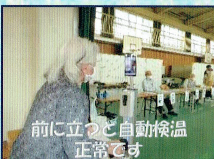
前に立つと自動検温 正常です

「すごいねー」と称賛の声があがっていました。 今年は子どもたちの書道作品や段ボールを使つての工作が目をひきました。 最後に福岡会長より「みなさまの作品があつてこそその作品展。作品展が『憩いの場』になつていただけたなら嬉しいかぎりです」と挨拶がありました。