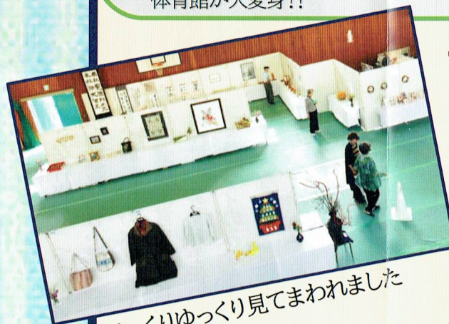
じっくりゆっくり見てまわれました