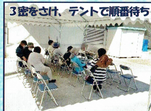
3密をさけ、テントで順番待ち