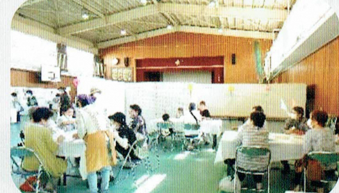
お久しぶり 同窓会みたいやね