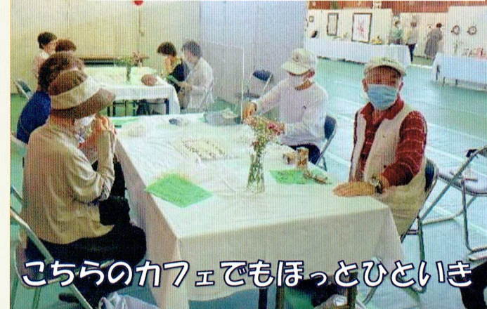
こちらのカフェでもほっとひといき