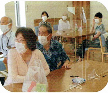
昼食後は、クイズに挑戦して いただきました。考え中です