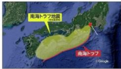
南海トラフ地震の予想震源域

回起きた1946年の地震から75年経っているため、そのような確率で言われているそうです。よく見ると、半分以上が冬に起こっているため、寒さと地震との間に何か因果関係があるのかもしれない。