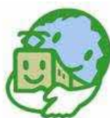
エコレールマーク