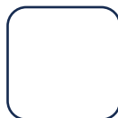
「バイオマスマーク」