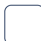
「再生紙使用マーク」