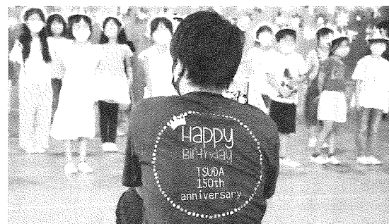
150周年記念Tシャツを作りました

最後に見出しは、私が全校児童、教職員に日ごろ伝えている言葉です。今後とも教職員一同、前向きにチャレンジしてまいりますので、ご協力よろしくお願いいたします。