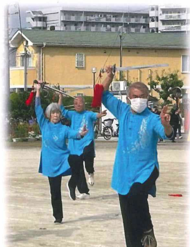
小倉太極拳倶楽部