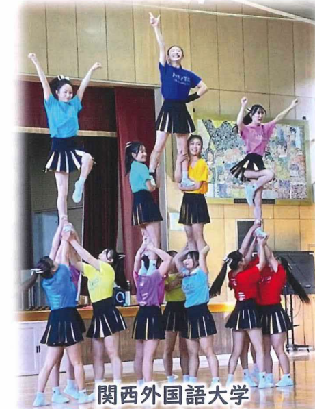
関西外国語大学 チアリーディング部