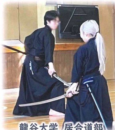
龍谷大学 居合道部