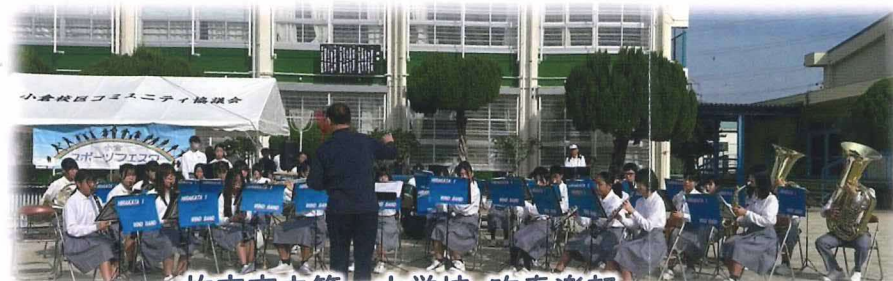
枚方市立第一中学校 吹奏楽部