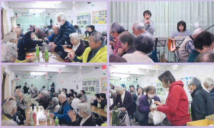
2026年2月1日 養父西住宅会・下島町・京阪住宅連合

皆さんが楽しみに待っていた「高齢者の集い」が、今年も開催されました。おいしいお食事をいただいた後はギターとマンドリンの演奏で、たくさん歌を歌ったり、じっくりと曲を聴いたりして楽しみました。最後はくじ引きであたった方は景品を、はずれた方も残念賞をもらって帰りました。