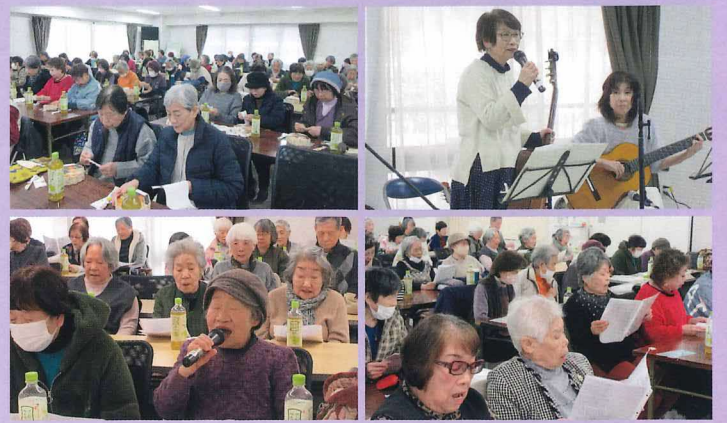
2026年2月14日 府宮牧野北住宅・公社牧野団地・グリーンステージ牧野