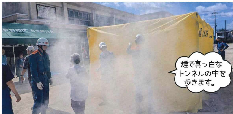
煙で真っ白な トンネルの中を 歩きます。