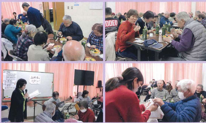
2026年2月8日 南船橋連合・府宮枚方船橋住宅・新上島・上島東・上島町新