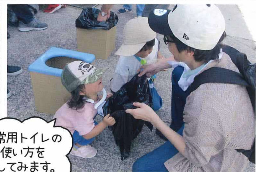
非常用トイレの 使い方を 試してみます。