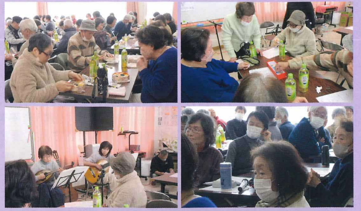
2026年2月7日 養父元町住宅連合・牧野荘園・上島町内会・西上島・西招提