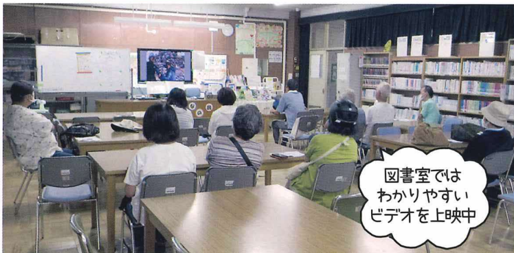
図書室では わかりやすい ビデオを上映中