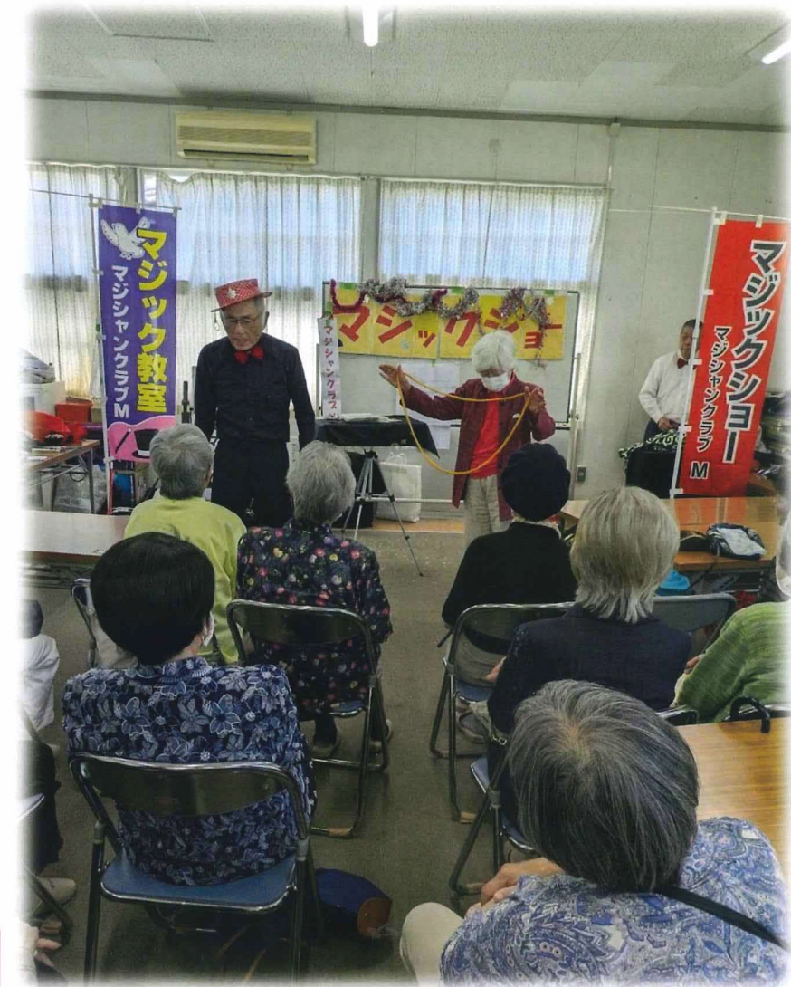
うまくできるかしら？いきますよ～

5月28日(水)ふれあい会食会を開催しました。今回は手品グループ「マジシャンクラブM」の3名によるマジックを観賞しました。