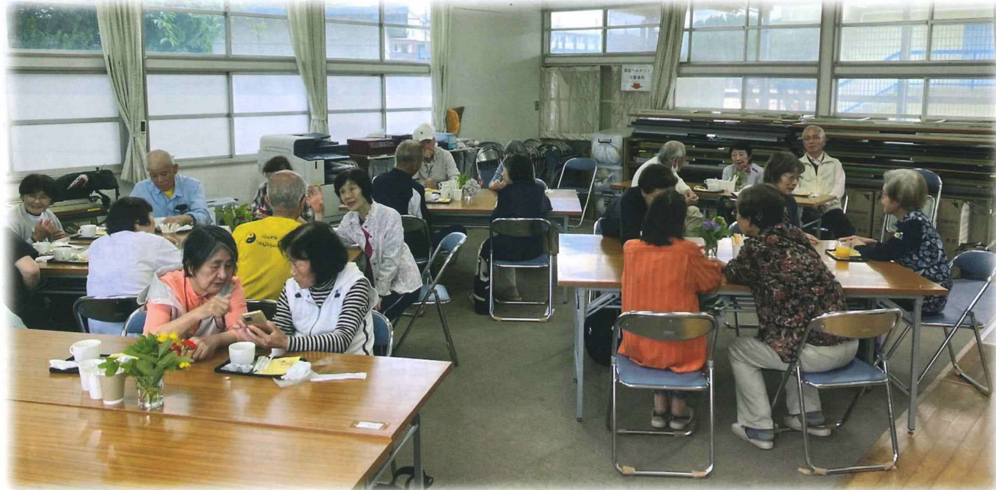
スマホ見ながら話が弾んでいるようですね～

5月17日(土)第一回おぐらカフェをオープンしました。各テーブルに花を置き、お客様をお迎えする準備をしました。あいにくの雨でしたが沢山の方に来て頂きありがとうございました。