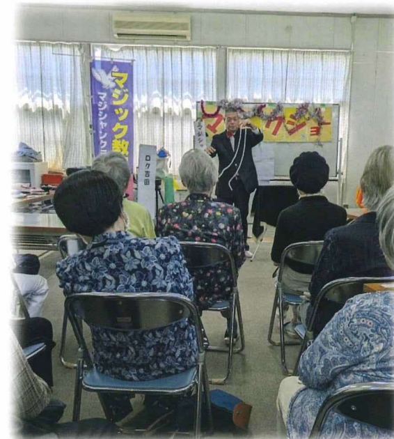
見てくださいね。ちんぷいぷい…