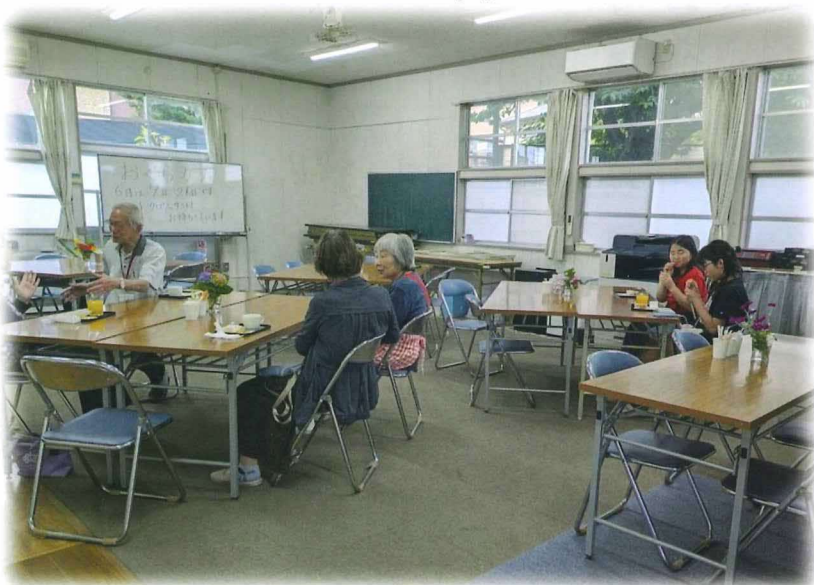
ようやくカフェは落ち着いたようですね

「集会室にはコーヒーの良い香りが漂ってたよ」とのお声も聞こえて来ました。どうぞ皆様のご来店お待ちしております。