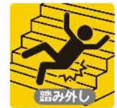
令和2年 転倒災害での休業日数別割合