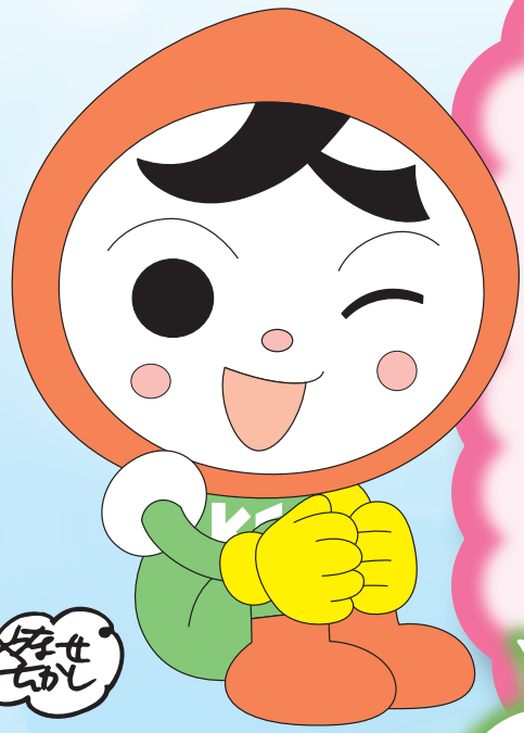
じんけん 人権イメージキャラクター 人KENまるる君