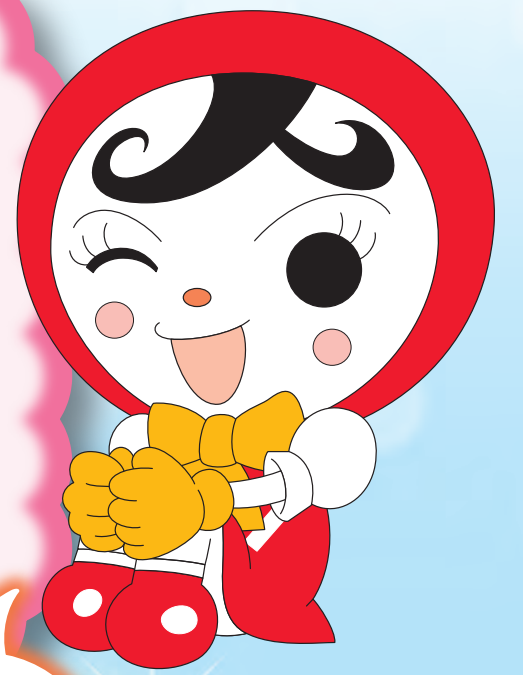
じんけん 人権イメージキャラクター 人KENあゆみちゃん