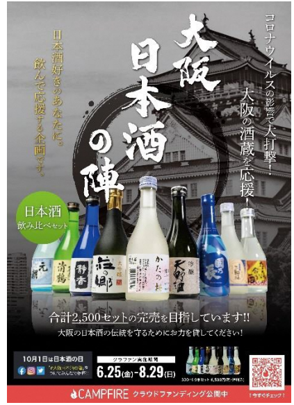
↑こちらが日本酒プロジェクトのチラシ。 。キャンプファイヤーというサイトで約2カ月間開催していました。

コロナ禍で飲食店での店内での利用は難しいこともあったりしますが、テイクアウトなどの取り組みをうまく利用しつつ、お気に入りの飲食店を応援していきたいですね!!