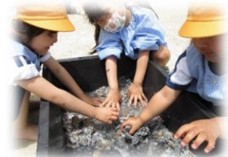
ちぎった新聞紙と水を混ぜて、新聞ねんど遊び♪ ふしぎな感触がとっても楽しかったようです!