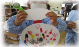
ゆめ組さんは、パスを使ってキャンディー作り♪