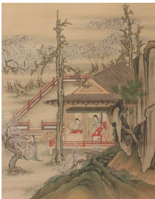
田能村直入「庭院梅花図」部分 (天門美術館寄託)