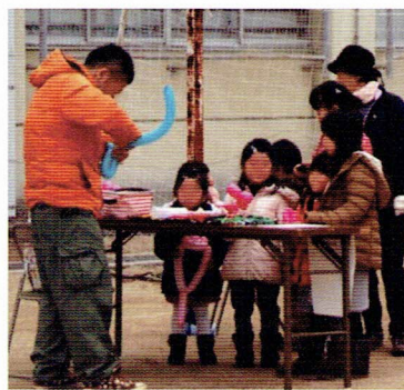
根強い人気、バルーンアート

来場者も順調に増え続け、振る舞いの焼いも、豚汁、ぜんざいは、きれいに出席しました。