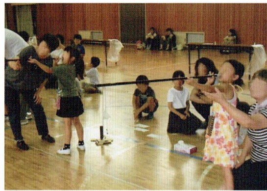
何事も、無心に優るものなし

まずは、スポーツ系で人気のある「スポーツ吹矢」のご紹介です。日本スポーツウエルネス吹矢協会・大阪ひらかた東支部の皆様にご協力頂いています。