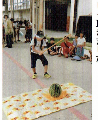
お命、頂戴しま…つた

サポーターの皆様は炭火で焼きあげて頂いたホッカイホカの焼いもに、子ども達はもちろん、保護者の方々も大満足でした。楽しい工作では七月の「水鉄砲」、十二月の「クリスタルツリー」。