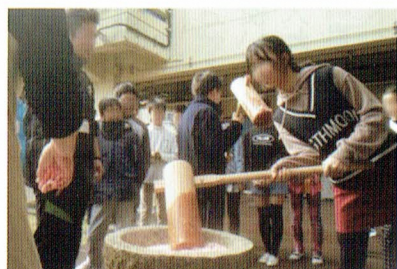
自分でついたお餅の味はまた格別

つき上がったお餅は、紅白の館入り丸餅にして、95名の卒業生全員と先生方に贈られました。お手伝い頂いたPTAのお母様が、ご苦労様でした。