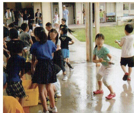
Bang! You're wet.

サポーターの皆様は炭火で焼きあげて頂いたホッカイホカの焼いもに、子ども達はもちろん、保護者の方々も大満足でした。楽しい工作では七月の「水鉄砲」、十二月の「クリスタルツリー」。