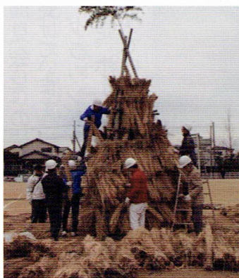
完成まで、あと一歩

年明け間もない1月12日(日)、とんど祭りが開催されました。当日は朝からどんよりとした曇り空。お天気を気にしながら、櫓 やぐら の設営、振る舞いの仕込みが進みます。