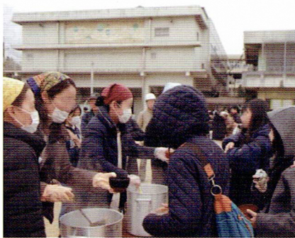
千客万来の豚汁ブース

来場者も順調に増え続け、振る舞いの焼いも、豚汁、ぜんざいは、きれいに出席しました。