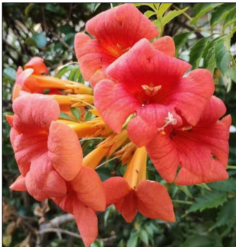
藤阪ハイツの凌霄花（ノウゼンカズラ） りょうしょうか 撮影場所：藤阪西町