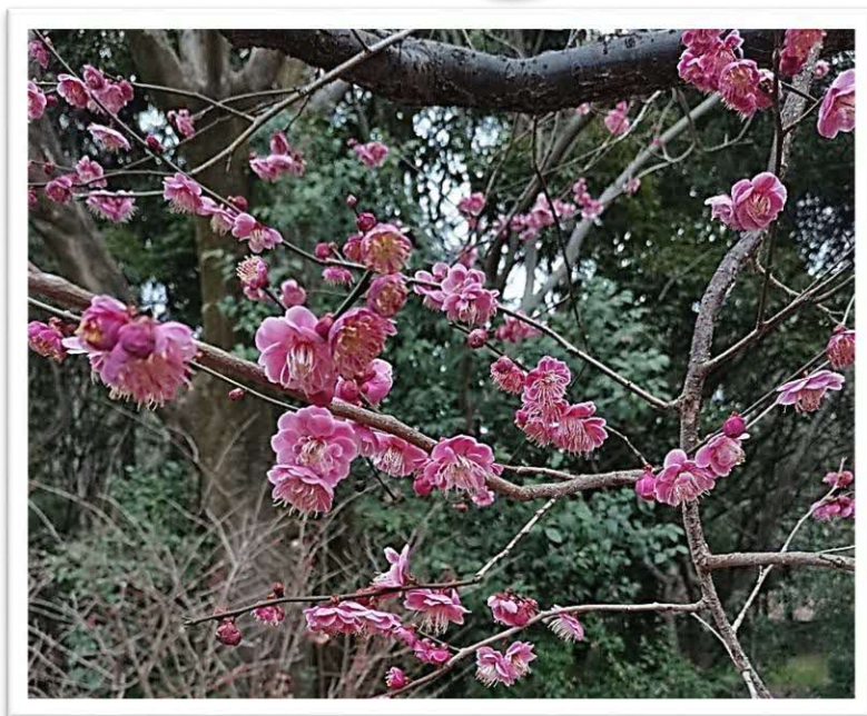
紅梅 五節（ごせち）の舞 撮影場所：大阪府立山田池公園 花木園梅林