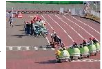
11月27日（金）5年生の校外学習は関西サイクルスポーツセンターに行きました。フリーパスで、自分の好きなアトラクションで思う存分楽しみました。次の日、筋肉痛の子もいたようです。→

先日、お知らせした通り、枚小ホームページと並行してブログ形式による情報発信を行っていきます。枚小ホームページからリンクを張っていますので、ぜひご覧ください。携帯サイトへは右のQRコードでアクセスできます。よろしくお願いいたします。