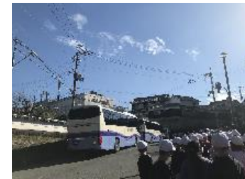
←11月24日（月）3年生は校外学習で「市内めぐり」を行いました。枚方市駅付近の官公庁団地から始まり、樟葉、家具団地、穂谷、香里とバスで巡りました。