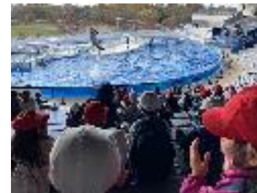
←11月26日（木）1年生は京都水族館へ。1年生にとっては初めての遠足となります。グループに分かれ館内を見学しました。「イルカパフォーマンス」にも大喜びでした。