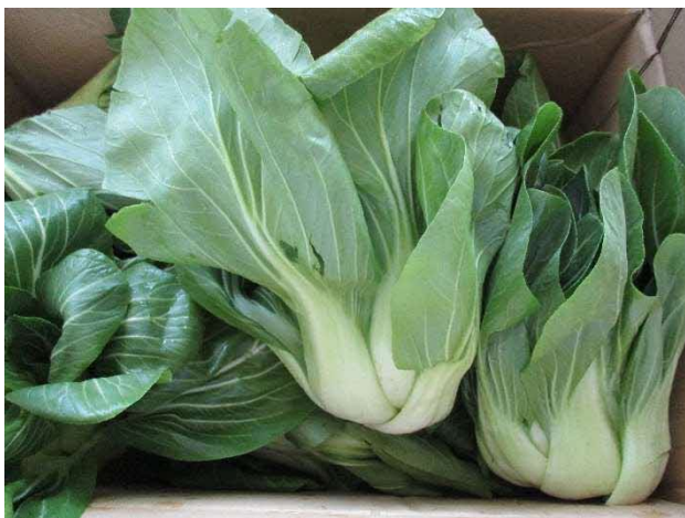
チンゲン菜（枚方産）

枚方市産農産物を学校給食へ供給することにより、子どもたちへの食育を推進するとともに地産地消を促進し、地域農業の振興を図っています。