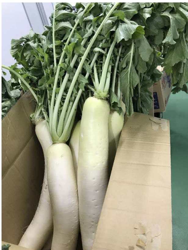
葉付き大根（枚方産）