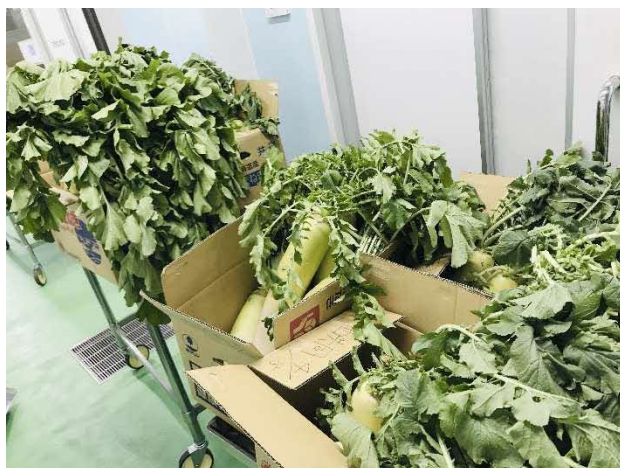
葉付き大根（枚方産）