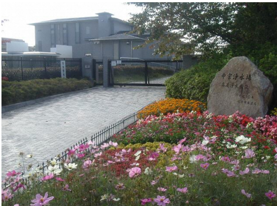
(写真) 中宮浄水場高度浄水施設