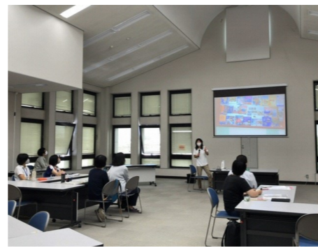
自校の取組を説明する学校司書

また、子どもの読書意欲を喚起させる技法の一つとしてテーマに沿って数冊の本を順序よく紹介する「ブックトーク」の研修を行いました。学年に合ったテーマの決定や本の選定から考え、意見を交流しながら内容を練り上げ、発表する研修を進めています。