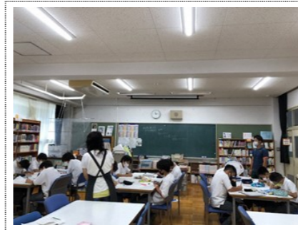
1年生の保健体育の授業 (招提北中学校)