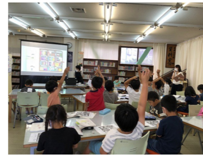
オリエンテーションのようす (菅原小学校)