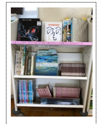
美術室に用意された資料