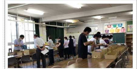
巡回展示のようす (樟葉小学校)

樟葉小学校でも、巡回展示に校区の学校司書が参加しました。教職員が選んだ本が蔵書にあるかどうか学校図書館システムで調べたり、子どもたちにとって、よりわかりやすい本はどれか、司書教諭と数冊の本を見比べながら相談する等、選書の手伝いをしていました。