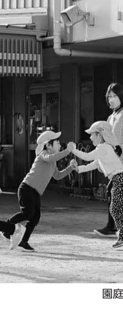
園庭で遊ぶ子どもたち

市長は、この間、枚方市駅周辺再整備事業における新庁舎整備の早期実現を言ってきたが、庁舎位置に関する条例の再提案は、庁舎位置の比較検討資料の提示を要する。