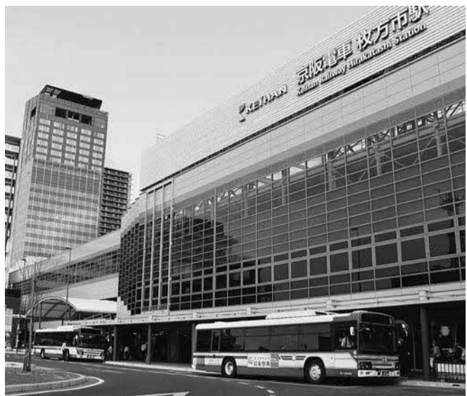
枚方市駅に乗り入れる京阪バス (写真は枚方市駅北口駅前広場)

また、路線廃止が具体化した場合、代替の移動手段の確保をどう検討していくのか。市長、路線バスをはじめ地域公共交通の維持は、本市の持続的な発展において重要な課題と認識し、これまでからバス事業者と協議を重ね、バス運行継続を要請しており、今後も変わらない姿勢で臨む。バス事業者からは、継続したいが運転手不足により厳しい状況と聞いており、今後、路線の廃止が具体的に示された