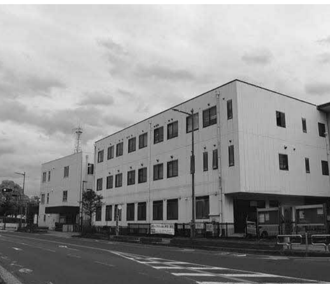
市庁舎分館や税務署、旧北河内府民センター付近を含む⑤街区

市長は、この間、枚方市駅周辺再整備事業における新庁舎整備の早期実現を言ってきたが、庁舎位置に関する条例の再提案は、庁舎位置の比較検討資料の提示を要する。