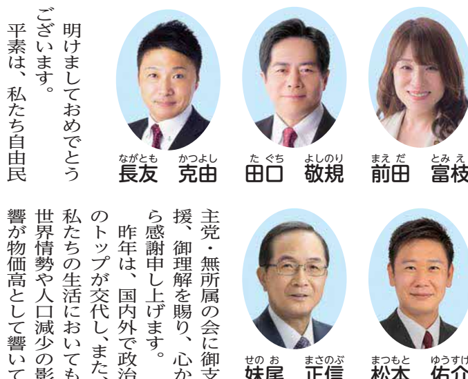
明けておめでとう ございます。 平素は、私たち自由民

くる等、非常に変化の大きい一年となりました。皆様は暮らしを守り、枚方市は安定した運営を目指さなければなりませんが、枚方市の財政は2年連続で単年度赤字を計上し、さらに、昨年は長期財政の見通しの大幅な悪化を急遽公表する等、先行き不透明な状況に陥っています。私たち自由民主党・無所属の会は、国とのパイプや知見、政策実現力を生かし、皆様の暮らしを守るため、枚方市の立て直しに全力を注ぎます。今後とも、一層の御指導、御支援を賜りますようお願い申し上げます。本年も皆様にありまして、よい年でありまよう御祈念申し上げます。