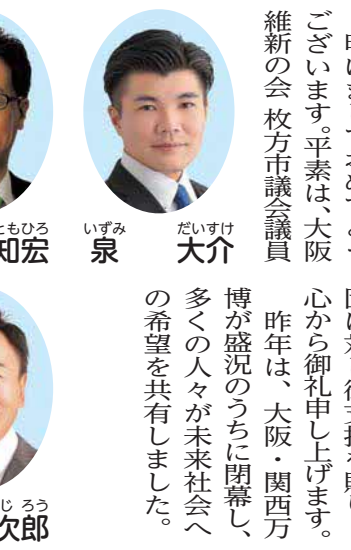
明けておめでとう ございます。平素は、大阪 維新の会枚方市議会議員 団に対し御支援を賜り、

本市でも、そのレガシーを地域発展に生かし、地域資源を活用した産業、観光の振興やスマートシティの実現など、まちの魅力と活力向上を目指して取り組んでまいります。一方で、人口減少と少子・高齢化により財政運営は一段と厳しさを増しています。公民連携やデジタル化など行政改革を進め、限られた財源を