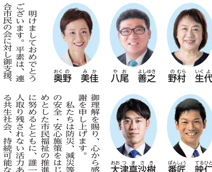
明けておめでとう ございます。平素は、連 合市民の会に対し御支援

社会の構築に向けて力を尽くしております。本年も生活者、労働者の立場で施策の推進に努めるとともに、政策活動を通じて市民一人ひとりに笑顔があふれる枚方市を実現するべく、全力で取り組んでまいります。また市民の皆様と、引き続き共に考え歩む姿勢で、暮らしの課題解決に努め、誰もが暮らしやすい枚方市を目指してまいります。併せて、二元代表制の一翼を担う市議会の役割を適切に果たすことで、市民にとって責任ある市政運営がされるよう努めてまいります。本年も引き続きの御支援を賜りますよう、よろしくお願い申し上げます。