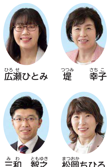
明けておめでとう ございます。日頃より日 本共産党議員団への御支 援を賜り、心より感謝申 上げます。 市民の命と暮らしを守

ある枚方から、憲法の理念を生かした平和で民主的なまちづくりを進めていく決意です。そして何より、住民福祉の増進という自治体の役割を發揮させるため、大規模災害に備え老朽化した市役所を現地で早期に建て替え、子育てや教育、医療や介護、老後の支援の充実、移動手段の確保と公共交通運賃助成の実現、地域経済の活性化など、安心して住み続けられるまちづくりに尽力します。本年も、市民の皆さんの声を市政へ届け、希望の持てる枚方をつくるため奮闘します。引き続き、御支援をよろしくお願いいたします。