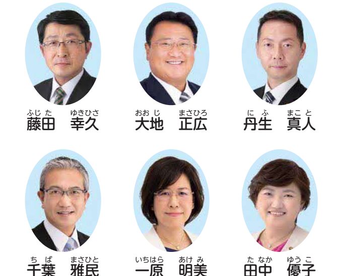
明けておめでとう ございます。 平素より公明党議員団 に対して御支援を賜り、誠 にありがとうございます。

取り組みました。その結果、高齢者の補聴器購入補助制度の対象を課税世帯まで拡大し、若者世代には本市独自の奨学金返還支援制度を、また、市民の安全、安心のため、自転車ヘルメット購入補助制度をそれぞれ実現することができました。本年も「小さな声を、聴く力」を存分に発揮しながら、物価高への対応や、福祉、文化、教育、防災などをはじめとした各分野の施策の充実に取り組み、全ての世代が希望を持って暮らせるまちを目指してまいります。本年が皆様にとりまして、幸多き年となりますよう御祈念申し上げます。