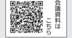
会議資料はこちら

送迎バスへの子どもの置き去り防止に安全装置導入を義務化など 児童福祉施設の設備及び運営に関する基準を定める条例等の一部改正を可決