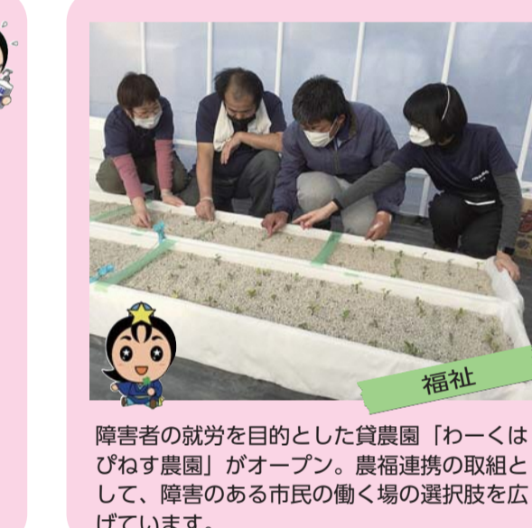
障害者の就労を目的とした貸農園「わーくはびねず農園」がオープン。農運連携の取組として、障害のある市民の働く場の選択肢を広げています。

が、市税収入は、感染症の影響などにより、今後とも厳しい状況が続くと予測されています。 その中で、社会保障関連経費の増大のほか、新庁舎の整備を含む市域周辺再整備など、多大な財政負担の伴う事業も見込まれており、これまで以上に収支の均衡を基本とした計画的な財政運営が求められています。市議会として、二元代表制の一翼を担う存在として、行政に対するチェック機能を十分に発揮してまいります。 あわせて、このような厳しい状況からこそ、現在の議会改革の取組をより一層進めるとともに、必要な施策、事業の实现に向け、市議会議員一同、全力を尽くしてまいります。 今後とも、こうした市議会の情報を市民の皆様とのパイプ役であるこの「枚方市議会報」に分かりやすく掲載することも、様々な工夫を重ね、より一層身近で親しまれる議会となれるよう努めてまいります。 本年が、皆様にとつて実り多き一年となり、また、令和2年度決算における本市の財政状況を御挨拶いたします。