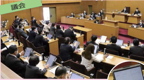
議会では、ペーパーレス化の推進等の観点から、本会議や委員会でのタブレット端末の導入を進めました。

昨年、新型コロナウイルス感染症への対応とともに、様々な分野での取組がありました。コロナ禍でも歩みを止めない枚方市の1年を、分野ごとに写真で振り返ります。