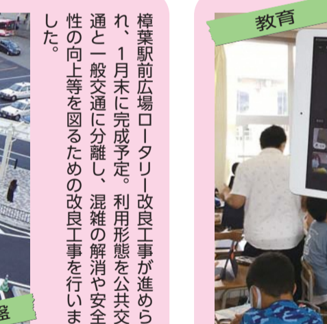
教育 緊急事態宣言中の8・9月には、市立小・中学校で「ハイブリッド型授業」を実施。全ての授業をオンライン配信することで、学校から配信されたタブレット端末を使用し、家庭からでも授業に参加できるよう取り組みました。