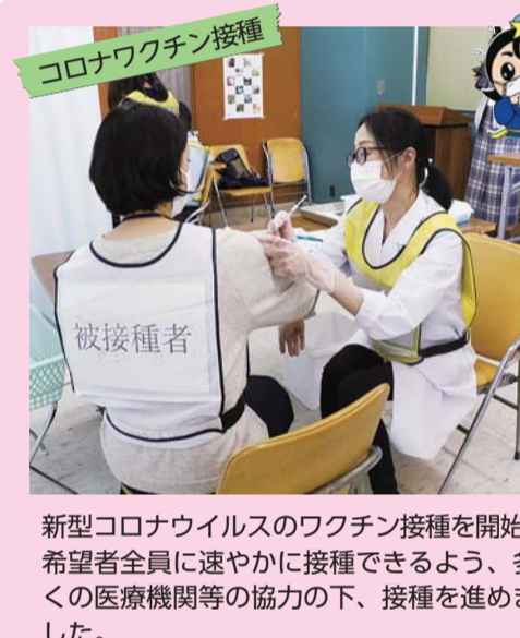
新型コロナウイルスのワクチン接種を開始。希望者全員に速やかに接種できるよう、多くの医療機関等の協力の下、接種を進めました。