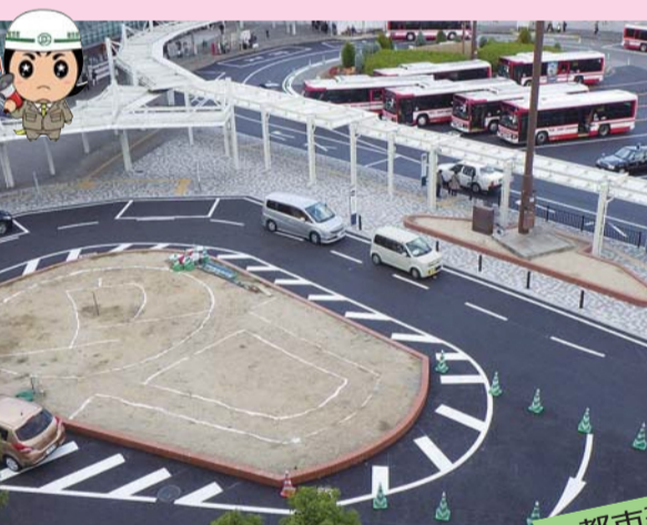
都市基盤 樟葉駅前広場ロータリー改良工事が進められ、1月末に完成予定。利用形態を公共交通と一般交通に分離し、混雑の解消や安全性の向上等を図るための改良工事を行いました。

議会は、11月30日の本会議で、「枚方市議会議員の給与に関する条例の一部改正案」を賛成多数で可決しました。 改正の内容は、大阪府市議会議員会が、11月15日から11月26日までの期間で開催されました。本研修は例年、対面形式で行われていたが、新型コロナウイルス感染症拡大防止の観点から、今年度は録画映像配信による開催となりました。