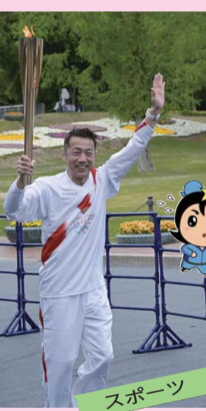
1年越しの東京オリンピック・パラリンピックが開催。ランナーたちは万博記念公園を走り、聖火をつなぎました。 ▲パラリンピックのトーチは市役所などにも展示されました。