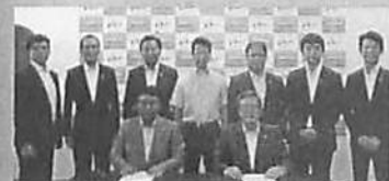
意見交換の後、府議、市長、市議団で

この意見交換会は、府の令和2年度の事業計画策定に向けて、市から府に対する要望を伝え、各項目について府から説明(答弁)を受けるものです。