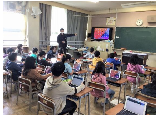
2年生への iPad 配付

新型コロナウイルスはまだまだ収束の兆しがありません。引き続き、学校では感染防止のための取り組み（検温、手洗い、マスク着用など）を行っています。ご家庭でもご協力をお願いします。