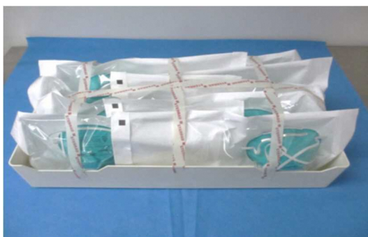
図 1：ロード用の N95 マスクの包装とトレイへの積載例