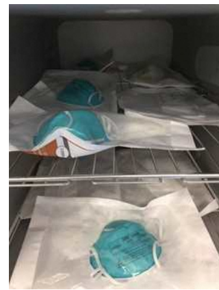
図 2：ロード用の N95 マスクの包装と棚への積載例