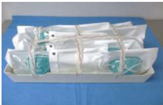
図 1：ロード用の N95 マスクの包装とトレイへの積載例