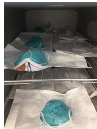
図 2：ロード用の N95 マスクの包装と棚への積載例