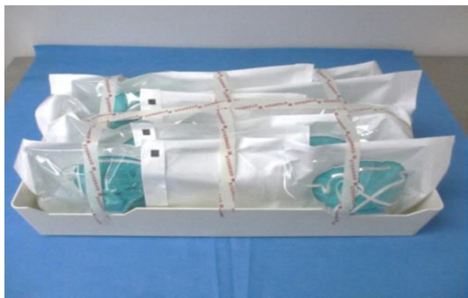
図 1：ロード用の N95 マスクの包装とトレイへの積載例