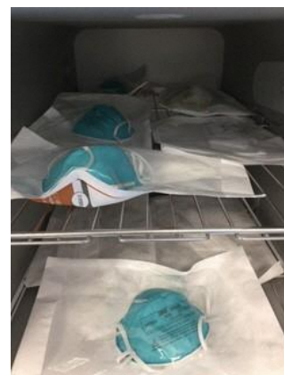
図 2：ロード用の N95 マスクの包装と棚への積載例