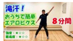
おうちでエアロビ