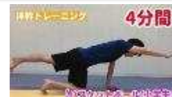
体幹トレーニング