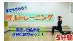
陸上トレーニング