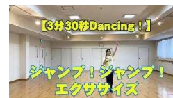
ジャンプエクササイズ