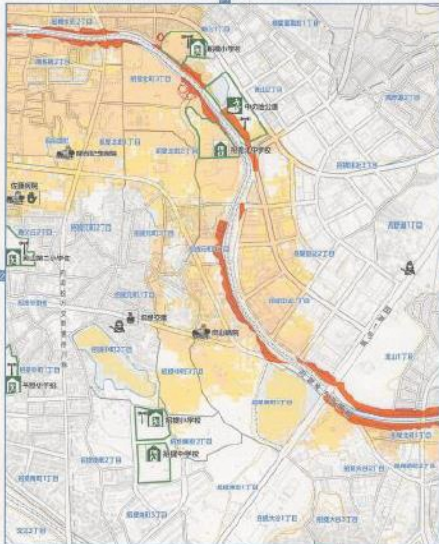
⑥ 船橋川洪水ハザードマップ