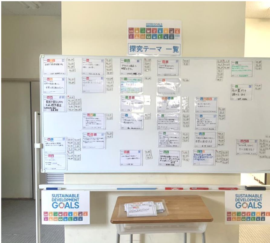
【アクション・プラン一覧】