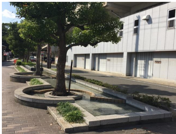
都市計画道路京阪南 2 号線の高架側道の歩道に設けられたせせらぎ水路