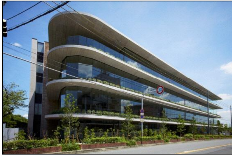
インターナショナル・コミュニケーション・センター (ICC)