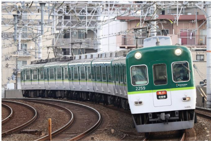
1: F0805A 2: 2209F 3: 急行淀屋橋

車両詳細の説明 1:列車番号 運行管理に必要で鉄道会社ごとに独自で決められている 2:編成番号 車両前面や側面などに書かれている番号 3:行先種別 特急出町柳行きなど