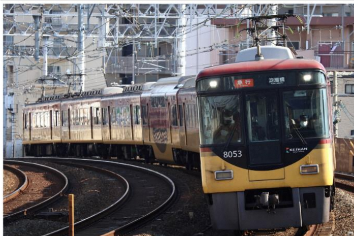
1: F1145A 2: 8003F 3: 急行淀屋橋

皆様あけましておめでとうございます、今年も京阪電車正月ダイヤがやってきました。正月三が日のみ運行される特別ダイヤの撮影に元旦から行って来ました。朝4時起床、7時前西三荘駅に到着、普段のダイヤでは走らない特急車両での急行や限定デザインのヘッドマークを付けた快速特急などを撮影しました。なお撮影終了は13時30分でした。