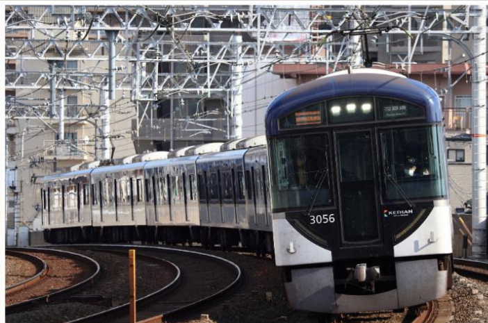
1: F1149A 2: 3006F 3: 急行淀屋橋