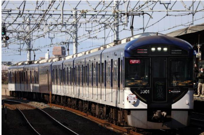
1: A1120Z 2: 3001F 3: 快速特急出町柳

皆様あけましておめでとうございます、今年も京阪電車正月ダイヤがやってきました。正月三が日のみ運行される特別ダイヤの撮影に元旦から行って来ました。朝4時起床、7時前西三荘駅に到着、普段のダイヤでは走らない特急車両での急行や限定デザインのヘッドマークを付けた快速特急などを撮影しました。なお撮影終了は13時30分でした。