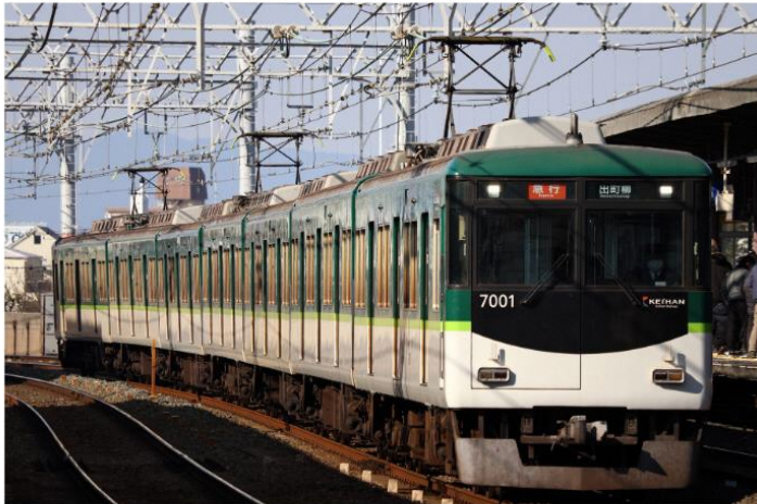
1: F1004Z 2: 7001F 3: 急行出町柳