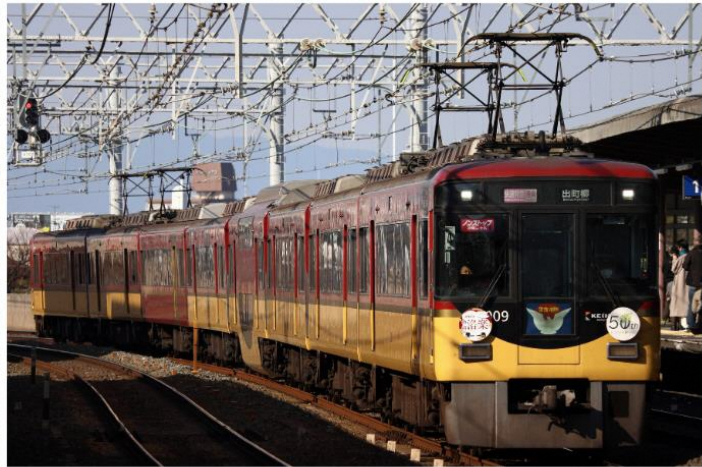
1: A1020Z 2: 8009F 3: 快速特急出町柳