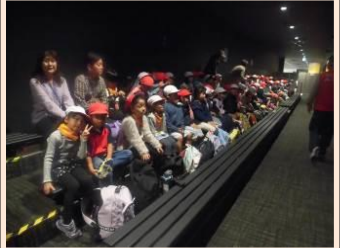
ジオラマ模型を見ます