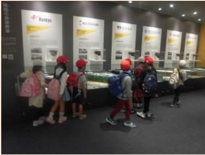
関西の私鉄の紹介です