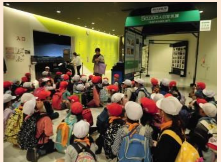
班で見て回ります