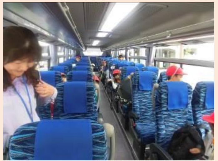
バスで学校まで戻ります