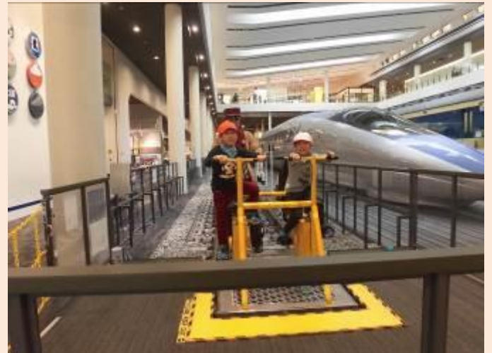
軌道自転車の体験です