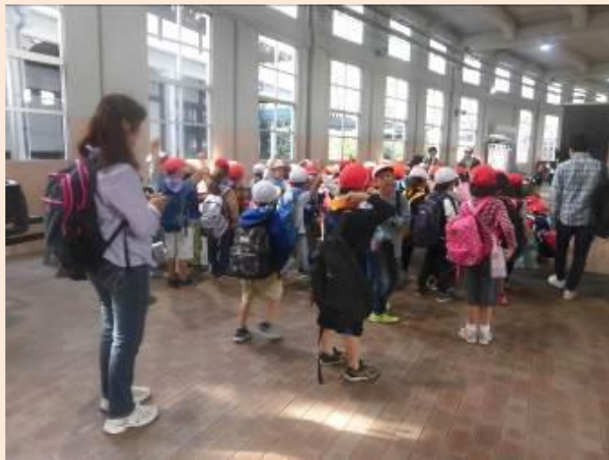
いっぱい見られたかな？