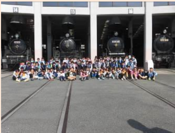
機関車の前で集合写真です