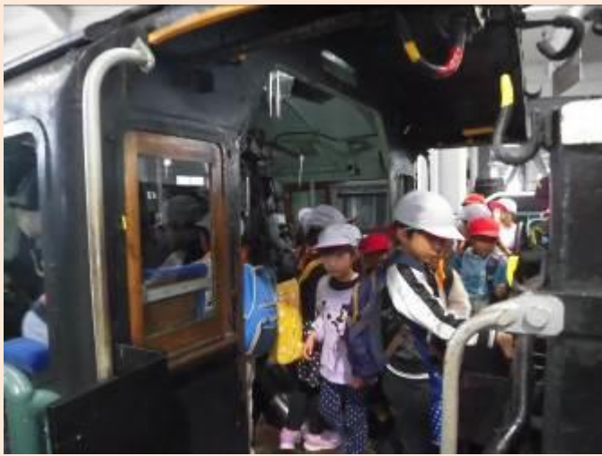
機関車の運転台にも入ります