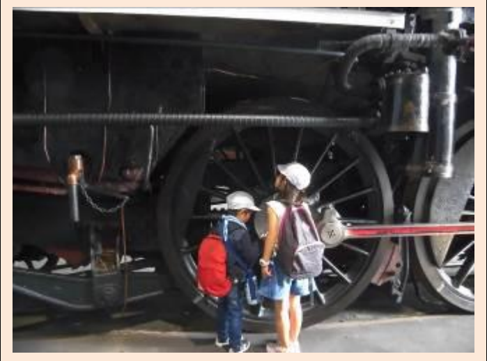
大きな車輪にびっくり!