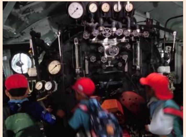
大きなボイラーです