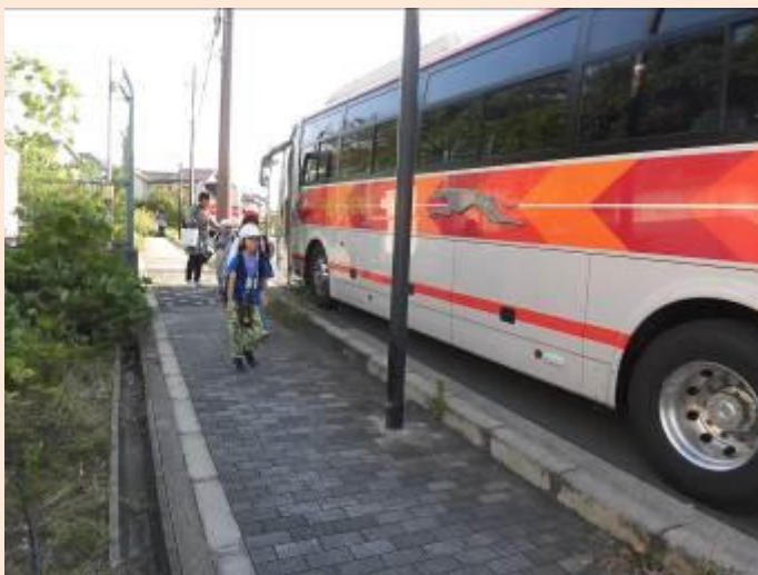
学校に戻ってきました