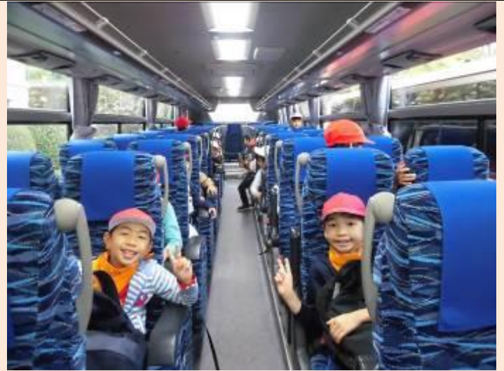
バスで向かいます