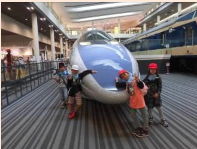
500系新幹線と撮りました