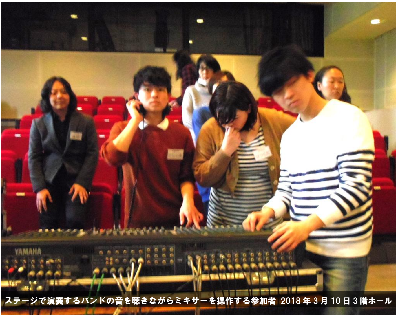
ステージで演奏するバンドの音を聴きながらミキサーを操作する参加者 2018年3月10日3階ホール

センターだよりの名称：中学生や高校生がやってみたいことを創り上げる場所として工場（FACTORY）をイメージしています。