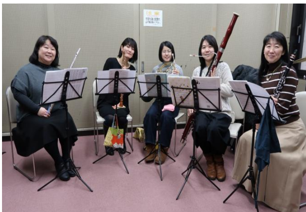
いい音楽といい仲間に出会えた 「アンサンブルミエル」さん

まずはメンバー仲良く、団結してこそ良い音楽が生まれると思います。そして、限られた時間を有意義に、