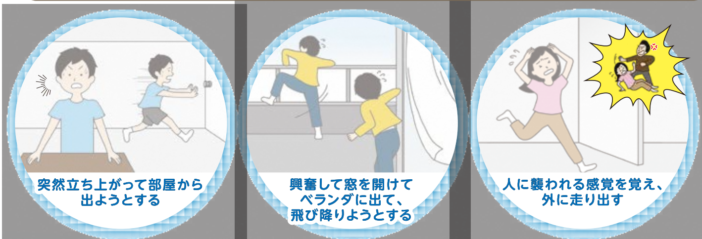
突然立ち上がって部屋から出ようとする