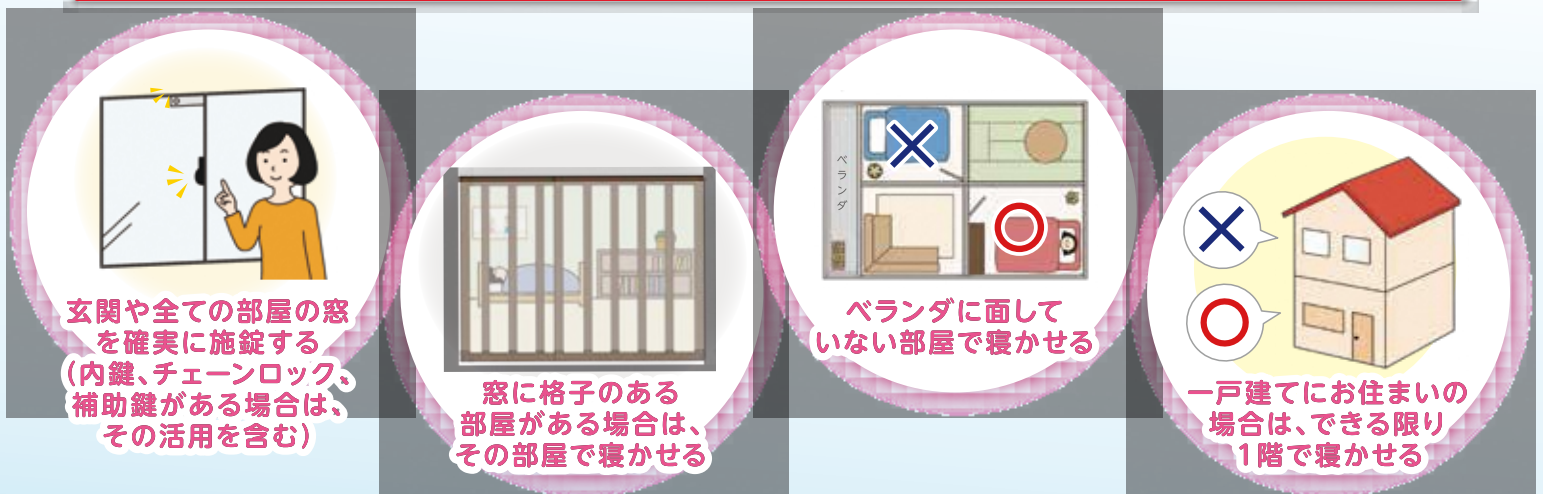
玄関や全ての部屋の窓を確実に施錠する(内鍵、チェーンロック、補助鍵がある場合は、その活用を含む)

発熱から少なくとも2日間は、就寝中を含め、特に小児・未成年者が容易に住居外へ飛び出さないために、例えば、以下のような具体的な対策を講じるよう、保護者の方にご説明ください。