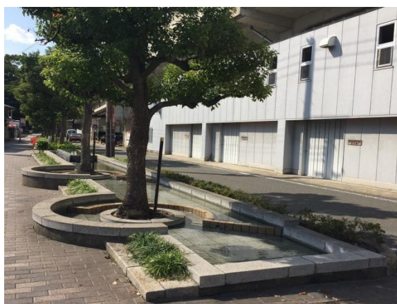
都市計画道路京阪南 2 号線の高架側道の歩道に設けられたせせらぎ水路