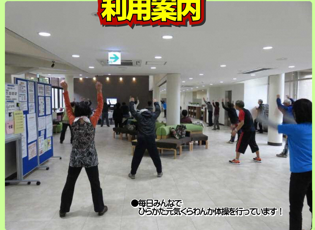
●毎日みんなで ひらかた元気くらわんか体操を行っています！