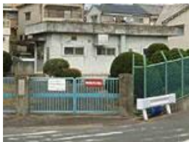
長尾家具町汚水中継ポンプ場(長尾家具町4丁目)