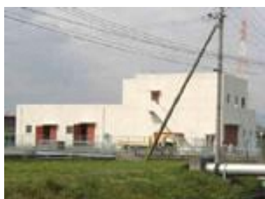
出口汚水中継ポンプ場(出口6丁目)