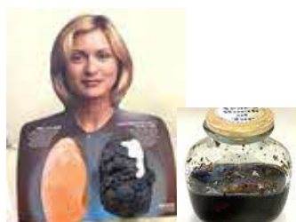
たばこに関する啓発物品