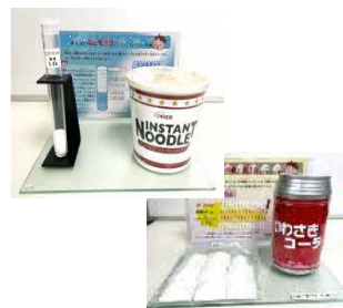
塩分や糖分に関する啓発物品