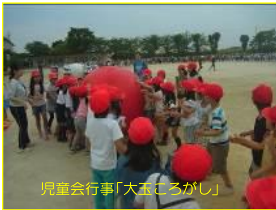
児童会行事「大玉ころがし」

1年生は市役所の交通対策課の人たちに来ていただいて、交通安全教室を行いました。これからも車や自転車に気をつけて、安全に事故なく登下校してくださいね。