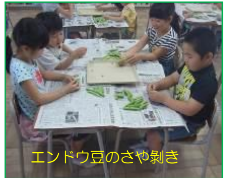
エンドウ豆のさや剥き

「1年生を楽しませよう！」をスローガンに、全校児童が赤と白に分かれて「大玉ころがし」を行いました。今年は接戦で、5回戦まで行い、わずかの差で白が勝ちました。