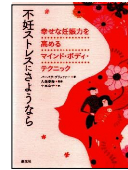
バーバラ・ブリッツァ/著 創元社 2014年