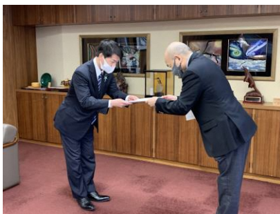
男女共同参画推進審議会会長より計画改訂の答申を受ける伏見市長

一人で抱え込まないで、まずはご相談ください。その一歩がご自身の生きづらさの軽減にとどまらず、性別にかかわらず自分らしく生きることができる男女共同参画社会づくりにつながります。