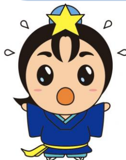
枚方市 ひこぼしくん

枚方市保健所 毎週平日火曜日 (受付時間：10時～11時30分) HIV検査と合わせて、梅毒 検査を実施 (無料、匿名、予約不要)