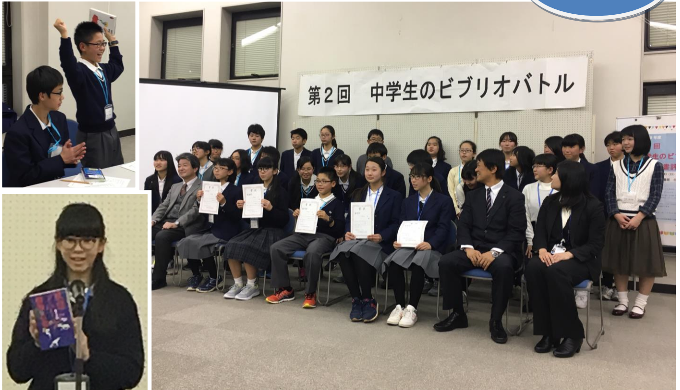
第 2 回中学生のビブリオバトル 3 月 5 日、中央図書館にて

3 月に第 2 回中学生のビブリオバトル、平和ライブラリーコンサート開催のほか、